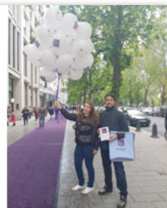
Thomas Rieder, Präsident Fragrance Foundation

„La Journée du Parfum - Tage des Parfums waren eine überaus gelungene Premiere. Die Düsseldorfer sind gekommen, um mit uns - den Marken und Händlern - faszinierende Parfumwelten zu erleben. Um zu riechen, zu plaudern und auch mal ganz neue Dufterfahrungen zu machen.“