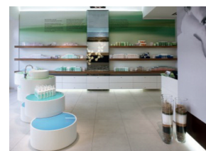
Concept Store Berlin

Neben zahlreichen Pflegelinien für sensible, trockene, fettige Haut, Körperpflege und Anti-Aging bietet AHAVA auch eine eigene Männer-, Sonnen- sowie Spa-Linie und seit 2010 auch Make-up an. Der AHAVA Concept Store in Berlin bietet seit 2007 neben Fachberatung zum gesamten AHAVA-Sortiment auch ein luxuriöses Day Spa.